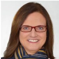
Petra Kramer | Deutschland

Landesrat für Land- und Forstwirtschaft, Tourismus und Bevölkerungsschutz